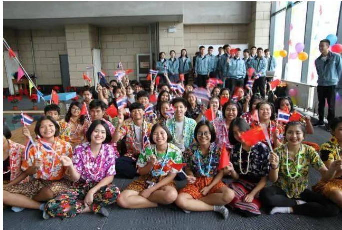
泰国鲁班工坊的学生们