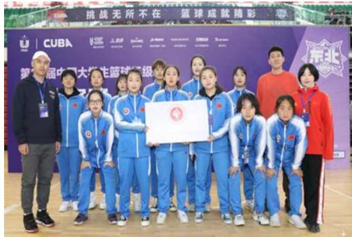
天津电子信息职业技术学院女子篮球队获东北赛区季军