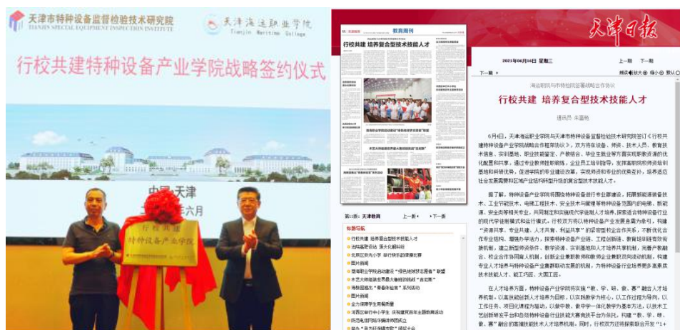
天津海运职业学院特种设备产业学院成立签约仪式与媒体报道

基地和科研优势，促进学院的专业建设改革，实现师资和专业的优势互补，培养适应社会发展需要和区域产业结构转型升级的复合型技术技能人才。