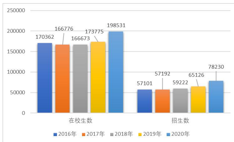
图1 2016年-2020年天津市高职在校生、招生变化（单位：人）