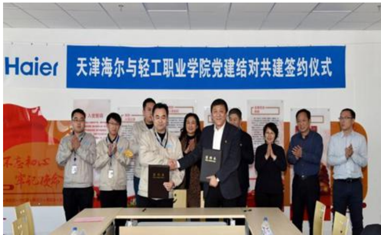
天津轻工职业技术学院与天津海尔工厂签署党建共建协议

械学院与海鸥手表、自动化学院与圣纳科技、经管学院与金地艺境社区、艺术学院与蓟州区村镇、联合支部与业务相关单位等共计8家开展党建共建。学院帮助海尔工厂党支部明确基层党建工作责任、提升党务人员业务能力，促进发挥党支部在企业生产、经营和发展中的作用，切实落实属地党建工作要求。与海尔工厂建立校企人员双向流动机制，构建校企命运共同体促发展，为海尔工厂成功搭建寻求合作伙伴的平台，帮助企业扎根天津，促进区域经济发展。