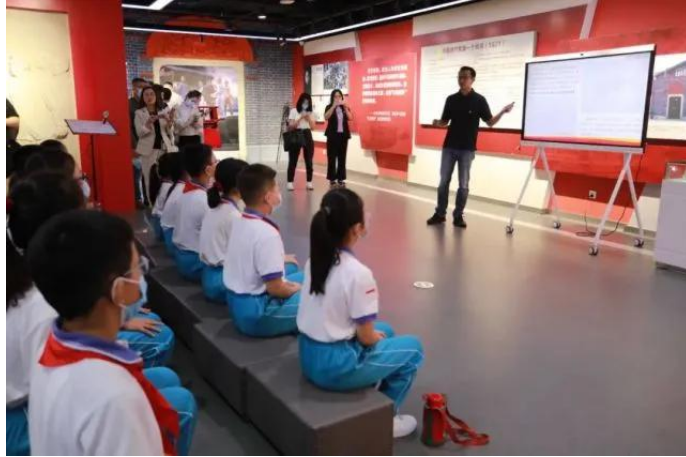
天津市津南区中小学校学生在“红馆”中上思政课

课程思政同心圆，建设完成天津市课程思政示范课等共计 21 门；天津交通职业学院通过“思政课程+课程思政”双带动，探索“三全育人”理念下交通工匠的培养模式。