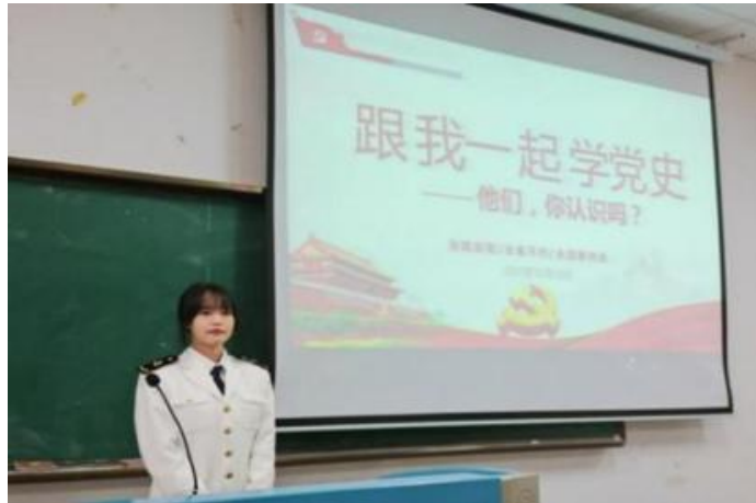
天津海运职业学院学生讲微党课

天津海运职业学院将党史学习教育纳入教学中，安排每堂思政课前5分钟作为学生进行党史学习成果展示环节，为学生开辟新的党史学习阵地，并形成固定模式。学生主动学党史、讲党史，每位学生都要上台展示，让党史学习教育在每位学生心中落地生根。结合庆祝中国共产党成立100周年，组织师生开展“百年百事微课堂，百生百讲大思政”活动，搜集整理从1921年至2021年的100年中的100个大事件，形成案例库。