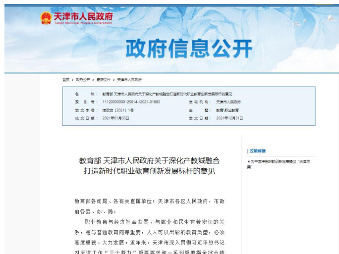
天津市人民政府网站公布标杆建设文件

2021年，《教育部 天津市人民政府关于深化产教城融合 打造新时代职业教育创新发展标杆的意见》印发，52项改革任务扎实有序推进，重点打造人才培养的新高地、打造制度创新的新引擎、打造体系构建的新标尺、打造质量提升的新支点、打造产教融合的新典范、打造国际交流的新窗口、打造涵养发展的新生态。